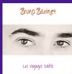
Les Voyages Subtils (2010)