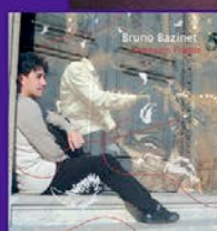
Attention Fragile (2006)