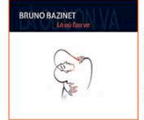
Illustration : Valérie Desrousseaux

Crée en avril 2016 au Théâtre Stéphane Gildas (Paris) Spectacle disponible toute l'année