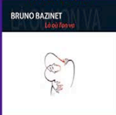
Là où l'on va (2014)