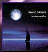
Destination Bleu (2004)

Sensible et lumineuse, émouvante et groovy, La musique de Bruno fait du bien à l'âme.